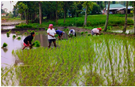
धान रोपाईमा किसानहरू : सोमवार धान रोपाईमा व्यस्त काफ्लेको कमल गाउँपालिका ७ स्थित मेमेङ टोलका किसानहरू ।