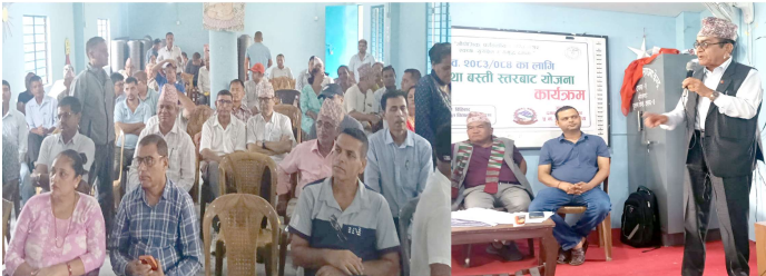
आव. ०८३/८४ का लागि बाईमा आएको बजेटको आधारमा टोलटोलबाट योजनाहरू प्रस्तुत गरी हलफल गर्नुपर्ने प्रक्रिया अनुसार विहीवार दिपिनी स्कूलमा भेला भएकामा प्रमुख अतिथि, बाई अध्यक्ष तथा सदस्यहरू र सर्वसाधारणको भेलामाको एक दृश्य ।

राष्ट्र...यस्तै, साना तथा मझौला क्षेत्रका लागि कर्जा प्रक्रिया सरल बनाउन र स्पष्ट मापदण्ड तोक्न सुझाव दिएका छन् । हाल बैकहरूले कन्भर्टिबल प्रक्रियाका कारण उद्यमीलाई व्यक्तिगत कर्जा लिन बाध्य पार्दा लागत बढेको महासंघको ठहर छ । बकिङ व्यापटल लोन टु सेल्स रैसियोलाई उद्योगको प्रकृति अनुसार परिमार्जन गर्न र हालको १२५ प्रतिशतलाई १२ प्रतिशतमा झार्ने महासंघले सुझाव दिएका छन् ।