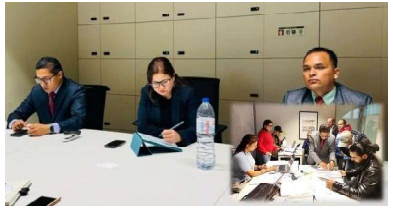
प्रमाणिकरणलायका कसुलु सेवा प्रदान गरिने दूतावासले स्पष्ट गरेको छ । यसै सन्दर्भमा पोर्चुगलस्थित नेपाली दूतावासले तीनवटा शहरमा शिविर सञ्चालन गर्ने लागिएको जानकारी दिँदै यसलाई अवसरका रूपमा लिई लाभान्वित हुन सक्ने सबैसँग अनुरोध गरेको छ । सो दूतावासले यसअघि पोर्चुगलको फारो, मदेइरा, पोती र ओदिमिरामा घुम्ती शिविर सञ्चालन गरी सेवा प्रदान गरेको जनाएको छ ।