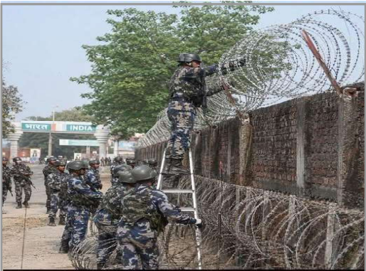
सुल्लुला सीमाका कारण तस्करहरूले पोका बनाएर सामान ओसारपसार गर्ने, पर्खाल चढ्ने र वारपाार गर्ने गतिविधि बढ्दै गएको स्थानीय स्तरबाट गुनासो आएपछि सशस्त्र प्रहरीले १ नम्बर गेट नजिक नेपाल तर्फको पर्खालमा सिमानामा नेपालतर्फको पर्खालमा काँडे तार लगाउने।