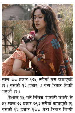
वैशाख २५ गते रिलिज 'मालती मंगले' ले ४१ लाख ७३ हजार ७९३ रूपैयाँ कमाएको छ । यसको १९ हजार १८८ वटा टिकट बिक्री भएको बोर्डले जनाएको छ ।

चलचित्र विकास बोर्डले 'लालीबजार' सहित ६ नेपाली फिल्महरूको पछिल्लो आधिकारिक बक्सअफिस विवरण सार्वजनिक गरेको छ । बोर्डले सो मबवार सार्वजनिक गरे को विवरणअनुसार फिल्म 'लालीबजार' को कमाई ८ करोड नाबिक पुगेको छ । वैशाख २५ गते रिलिज फिल्मले गत शनिवार (जेठ १६ गते) सम्म विनेमा: बक्सअफिसमा ७ करोड ९० लाख ३१ हजार ४६९ रूपैयाँ गस कमाई गरेको हो । उक्त कमाई हुँदा फिल्मको २ लाख ६९ हजार २०२ वटा टिकट बिक्री भएको छ । त्यस्तै, 'पराजको आगो' ले ४ करोड २० लाख ४४ हजार ४४४ रूपैयाँ गस कमाएको छ । वैशाख ११ गते रिलिज यो फिल्मको १ लाख ४४ हजार ३४ वटा टिकट बिक्री भएको छ । जेठ ६ गते रिलिज 'मितन्जु' ले १ करोड २० लाख ४९ हजार ००२ रूपैयाँ कमाएको छ । यसको ४१ हजार २४८ वटा टिकट बिक्री भएको उल्लेख छ । त्यस्तै, जेठ ६ म रिलिज फिल्म 'काजी' ले ४०