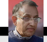
महेश आचार्य (पूर्व अर्थमन्त्री)

अन्तर्राष्ट्रिय परिदृष्ट्यले यसै पनि हाम्रो आर्थिक विकासको प्रक्रिया शिथिल भइराखेको बेला छ। आगामी दिनमा कसरी हामीले सात प्रतिशतको आर्थिक बृद्धि हासिल गर्न सकौंला ? यो चुनौतीपूर्ण छ।