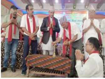
छ। कार्यक्रमका सहभागीहरूले प्रशिक्षणलाई महत्वपूर्ण अवसरका सांस्कृतिक पहिचान जोगाउन रुम्मा लिएका केटी ठेकाल

दमक/ ब्राह्मण समाज नेपाल कापा जिल्ला समिति र दमक नगर समितिको आयोजनामा ब्राह्मण-सेत्री समुदायका सांस्कृतिक धरोहरका रूपमा रहेका बालन, सिंगीनी नाच र खेजडी संरक्षणसम्बन्धी दुई दिने प्रशिक्षण कार्यक्रम सुरु भएको छ। दमकस्थित पशुपति मन्दिरको सभाहलमा दमक नगरपालिकाको सहयोगमा सुरु भएको उक्त कार्यक्रममा लोपोन्मुख सांस्कृतिक संरक्षण र पुस्तान्तरणमा जोड दिइएको