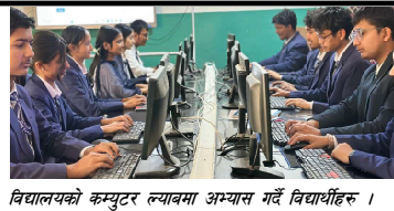
विद्यालयको कम्प्युटर ल्याबमा अभ्यास गर्दै विद्यार्थीहरू ।