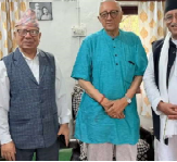
केन्द्रित रहेर कुराकानी भएको बताए।

मोरङ/ नेपाली कम्युनिस्ट पार्टी (नेकपा)को केवला गरी प्रवृद्धानमन्त्री पुष्पकमल दाहाल 'प्रचण्ड' र सहसंयोजक एवं पूर्वप्रवृद्धानमन्त्री माधवकुमार नेपालले नेपाली कांग्रेसका नेता डा. शेखर कोइरालासँग विराटनगरस्थित कोइराला निवासमा गोप्य भेटवार्ता गरेका छन्। शुक्रबार विहारण भएको भन्ने ४५ मिनेट लामो भेटमा पुष्पकको समसामयिक राजनीतिक अवस्था, संसदीय प्रक्रिया, नेपाली कांग्रेसको पछिल्लो अवस्था तथा राष्ट्रिय सरोकारका विषयमा छलफल भएको नेताहरूले बताएका छन्। भेटपछि सञ्चारकर्मीसँग कुरा गर्दै प्रचण्डले समसामयिक राजनीतिक विषयमा