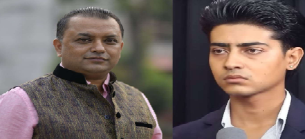
लोकतन्त्र मान्ने व्यक्तिका लागि दुःखको कुरा हो। ढुङ्गाले पुराना राजनीतिक शक्तिहरूमा अब नैतिक आकर्षण समाप्त