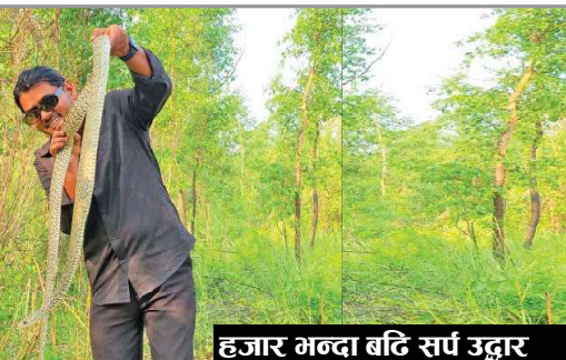
हजार भन्दा बढि सर्प उद्धार