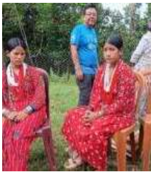
मेलासँगै आयोजकले सार्वजनिक गरेको आभारसहितमा राउटे समुदायलाई 'मनोरञ्जनको वस्तु' वा 'प्रदर्शनी' का रूपमा व्यवहार नगर्न आग्रह गरिएको छ। आगुचुक, सञ्चारकर्मी तथा स्वयंसेवकलाई उनीहरूको आत्मसम्मान, व्यक्तिगत स्वतन्त्रता र सांस्कृतिक संवेदनशीलतालाई ध्यानमा राख्न अनुरोध गरिएको छ। फोटो तथा भिडियो खिन्नुअघि अनुमति लिनुपर्ने, बाबुलािकाको तस्बिर सावधानीपूर्वक मात्र प्रयोग गर्नुपर्ने तथा बसोबास क्षेत्रमा जनबर्जती प्रवेश गर्न नपाइने उल्लेख गरिएको छ।

मिकलाजुङ। मोरङको मिकलाजुङ ३ स्थित नैसेढुङ्गा पार्कमा एक घण्टेको सभ्यता लोपोन्मुख राउटे जाति विशेष मेला आयोजना गरिएको छ। यसबाट निरुद्ध मेला (उल्टोघर) को आयोजना सुरु गरिएको मेलाले नेपालको लोपोन्मुख तथा घुम्नै आदिवासी राउटे समुदायको संस्कृति, परम्परा र जीवनशैलीको संरक्षण तथा प्रवर्द्धन गर्ने उद्देश्य लिएको जनाएको छ। मेला ९ जेठसम्म चल्ने छ।