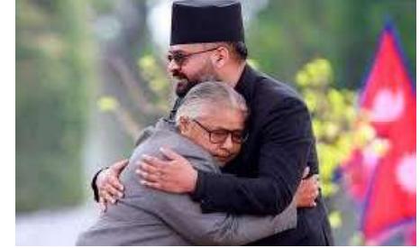
गरीएको टिप्पणीहरू सार्वजनिक भइरहेका छन् । पूर्वप्रधानमन्त्री सुरीला कार्कीको

यस विवादमा एउटा महत्वपूर्ण प्रश्न उठेको छ—यदि प्रधानन्यायाधीश स्वतः वरिष्ठताकै आधारमा बन्ने हो भने संवैधानिक परिषद्, सिफारिस प्रक्रिया र संसदीय सुनुवाइ किन आवश्यक भयो ? यही प्रश्नलाई आधार बनाएर केहीले अहिलेको निर्णयलाई 'स्थिर शक्ति संरचना तोड्ने