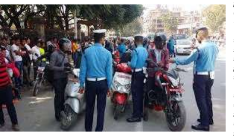
सवारी साधनबाट ३ लाख १७ हजार रुपैयाँ जरिवाना गरिएको छ भने ९१ सवारी साधनलाई थप कारवाहीको लागि यातायात व्यवस्था कार्यालय पठाइएको छ । ध्वनि प्रहृषण

इटरी/ नेपाल प्रहरी राजमार्ग सुरक्षा तथा ट्राफिक व्यवस्थापन कार्यालयले वैशाख ५ देखि १७ गतेसम्म सञ्चालन गरेको विशेष ट्राफिक अभियानपछि कोशी प्रदेशमा सडक अनुशासनमा सुधार आएको दाबी गरेको छ । अभियानका क्रममा ट्राफिक नियम उल्लङ्घन गर्ने ५ हजार ९०१ सवारी साधनमाथि कारवाही गरिएको कार्यालयले जनाएको छ । कार्यालयका अनुसार मादक पदार्थ सेवन गरेर सवारी चलाउने ६०२ चालक कारवाहीमा परेका छन्, जसबाट ३ लाख १७ हजार रुपैयाँ जरिवाना असुल गरिएको छ । काण्डा, ओखलढुङ्गा र खोटाङमा गरिएको लागू पदार्थ परीक्षणमा ९५ चालक जीव गर्दा ५ जना पोलिटिम भएएका छन् । अभिलेख नियन्त्रण अभियानसँगै १००