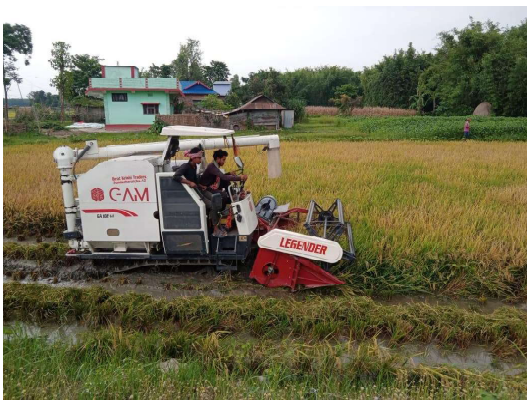
मोरङको धनपालथानमा आधुनिक उपकरणको प्रयोगको गरि बषैधान काट्दै किसान । केहि वर्षपछा कृषि क्षेत्रमा बढ्दो उपकरण र यन्त्रहरूको प्रयोगले कृषि कर्मलाई सहज बनाउँदै लगेको छ ।