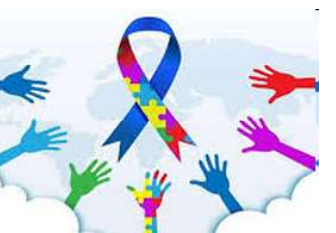
सन्दर्भ : विश्व अटिजम दिवस

अटिजमलाई भावनात्मक उपेक्षा र मानसिक रोगसँग जोडेर सन् १९५०-१९७० को दशकलाई गलत धारणा र कलको रमा हेरिएको देखिन्छ । विस्तारै अनुसन्धानकर्ताहरूले अटिजम अभिभावकको कारणले नभई रमा (neurological) र विकासोन्मुखी अवस्था हो भन्ने पत्ता लगाए । वैज्ञानिक प्रगति र मान्यताको रमा (१९८०-१९९० को दशक) सन् १९८० मा (Diagnostic and Statistical Manual of Mental Disorders third edition -DSM-III) मा अटिजमलाई औपचारिक रूपमा विकासोन्मुखी विकारका रमा समावेश गरिएपछि ठूलो परिवर्तन आयो । यस अवधिमा जनचेतना बढ्न थाल्यो प्रारम्भिक हस्तक्षेपका (early intervention) कार्यक्रमहरू सुरु भए, अभिभावक र अधिकार समूहहरू सक्रिय भए, थप बालबालिकाको पहिचानमा सहयोग हुन थाल्यो ।