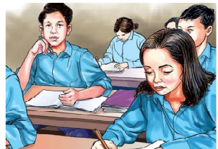
सहभागी भएर हालसम्म उत्तीर्ण हुन नसकेका विद्यार्थीहरू पनि यसपटक परीक्षामा सहभागी हुनेछन्।

दमक/पहिले फलामे ढोका भनिने गरेको माध्यमिक शिक्षा परीक्षा (एसईई) आज विहीबारदेखि शुरु हुँदैछ। यसपटकको परीक्षामा देशभरिबाट ५ लाख १२ हजार ४ सय ७९ जना विद्यार्थीहरू सामेल हुने भएका छन्। परीक्षाका लागि सम्पूर्ण तयारी बुधबारने पूरा भइसकेको राष्ट्रिय परीक्षा बोर्डले जनाएको छ। नयाँ बालेन सरकार बनेपछि यसपटक अधिल्ला वर्षहरूको पर्यस्त्रालाई तोड्दै परीक्षा केन्द्रमा विद्यार्थीहरूको उत्तरपुस्तिका जाँच गर्न र १ महिनामित्र नतिजा प्रकाशित गर्ने निर्णय भइसकेको छ। यसबाट एसईई परीक्षामा पनि क्रमभङ्गा हुन लागेको छ।